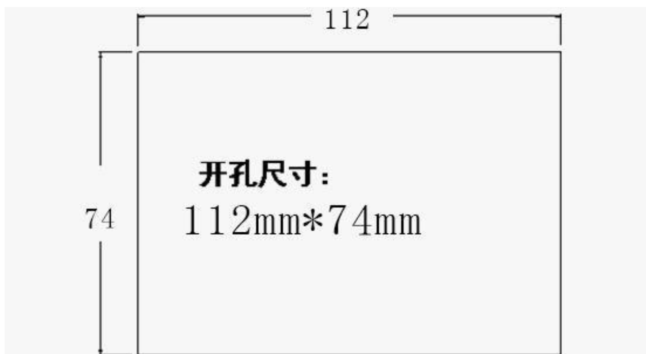
触摸屏开孔尺寸为：112mm x 74mm